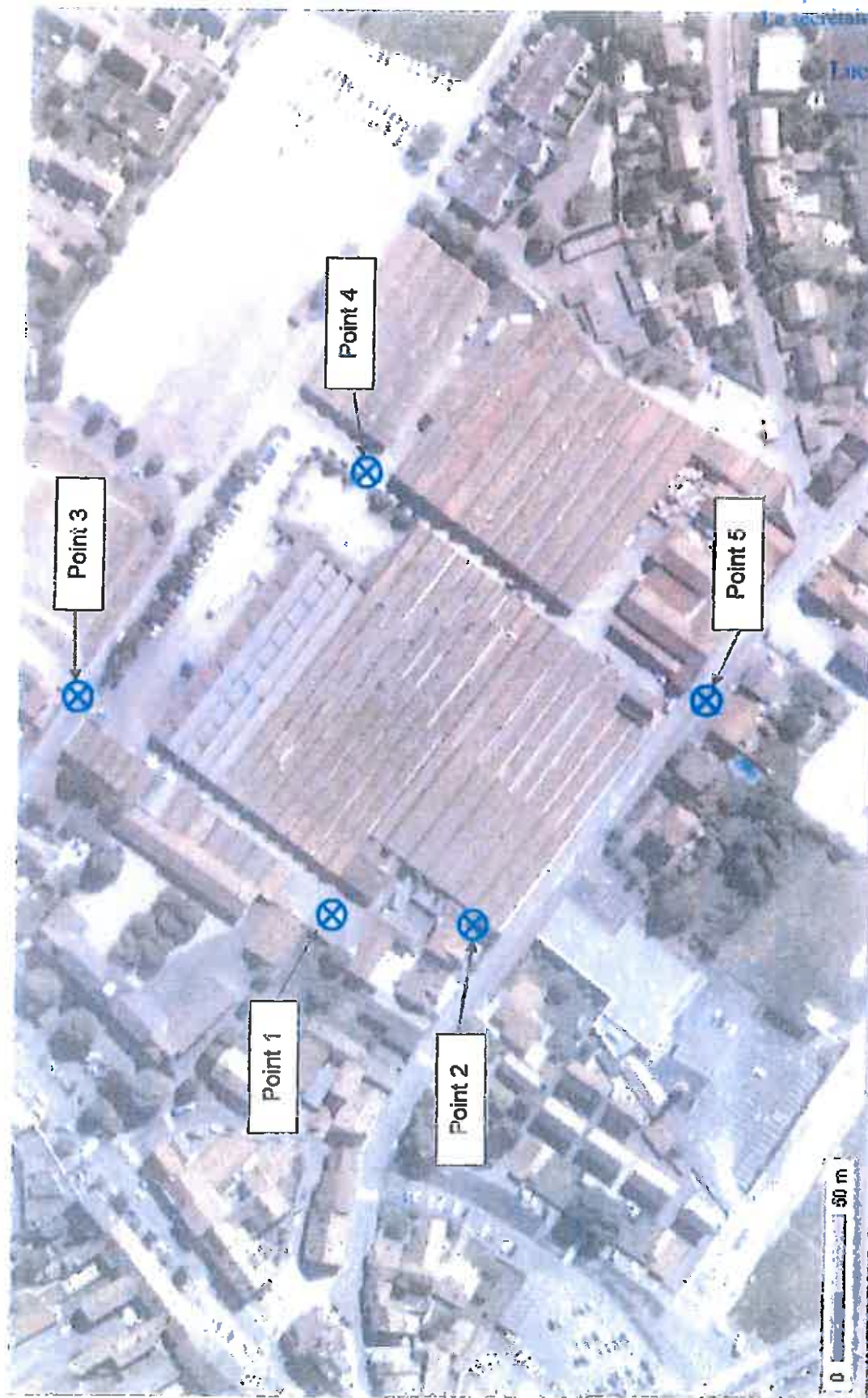
Localisation des points de mesures